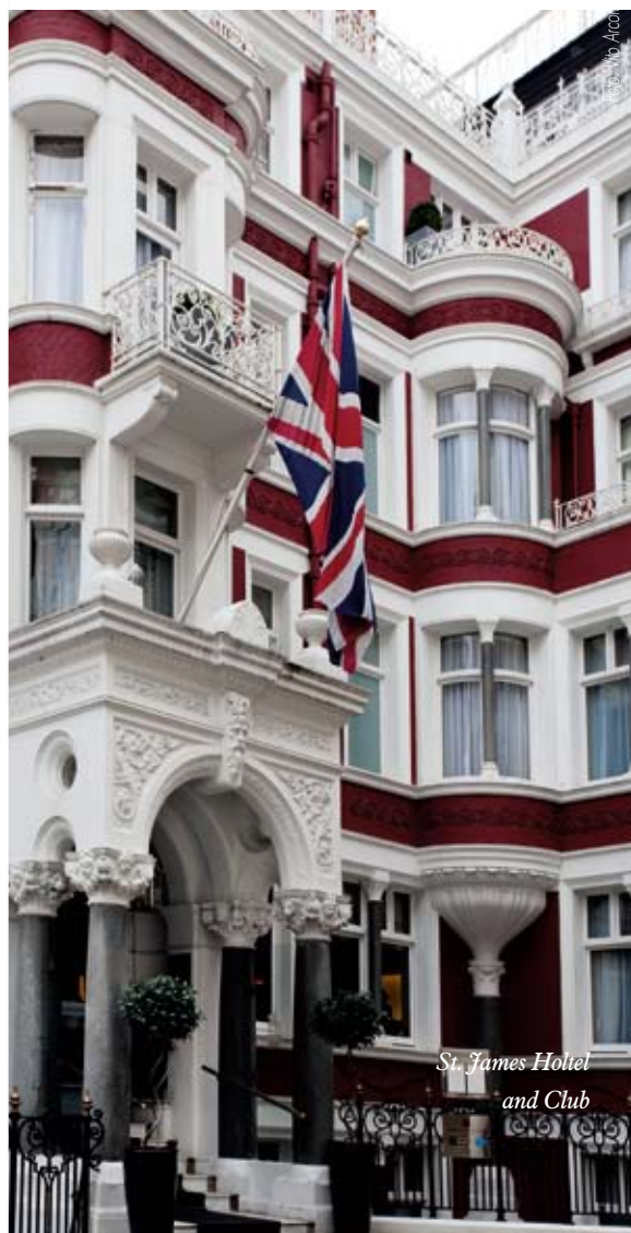
St. James Hotel and Club