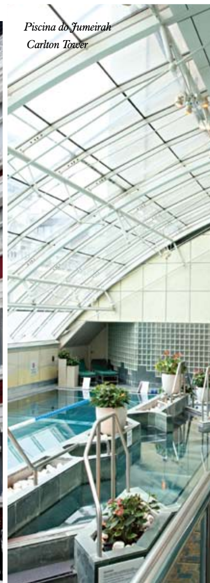
Piscina do Fumeyrah Carlton Tower