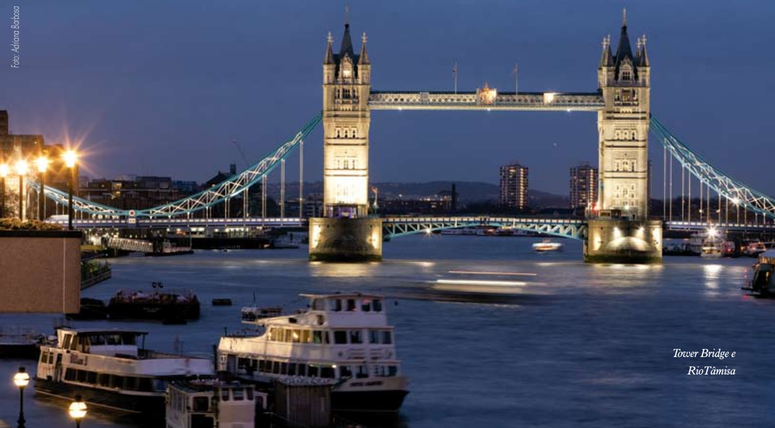
Tower Bridge e Rio Tâmsa