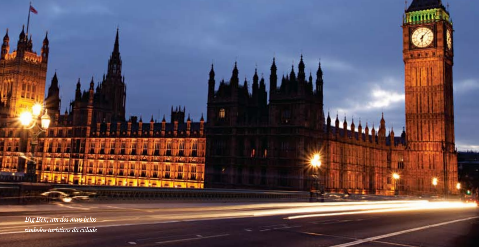
Big Ben, um dos mais belos símbolos turísticos da cidade