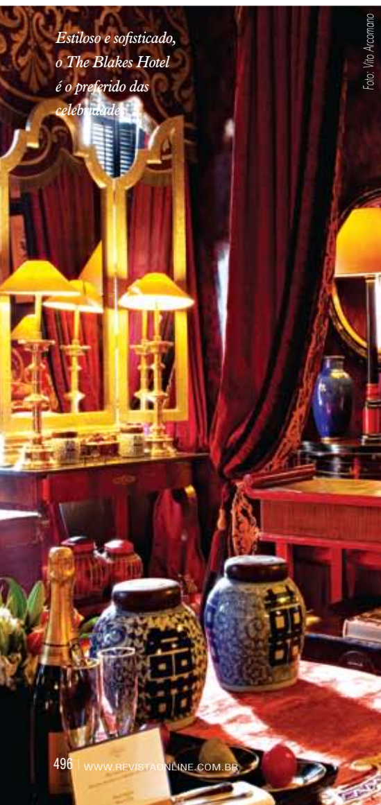
Estiloso e sofisticado, o The Blakes Hotel é o preferido das celebridades

bucólica Stratford-upon-Avon, no condado de Warwickshire. Conhecido como terra de Shakespeare, é um romântico vilarejo a três horas de Londres onde o prazer é caminhar desapressadamente por suas ruas e apreciar os belos castelos, jardins e casarios dos séculos 16 e 17. Não deixe de visitar a casa, em estilo Tudor, onde nasceu o dramaturgo e poeta inglês, e a Holy Trinity Church, onde o renomado artista foi batizado e enterado. Já na histórica cidade de Bath, ao sudoeste do país, o prazer é desfrutar dos fantásticos banhos termais e os exclusivos tratamentos corporais oferecidos pelo Thermae Bath Spa, centro de relaxamento que utiliza as propriedades curativas da água proveniente de fontes naturais. Puro luxo!